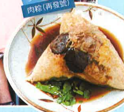
ちまき 肉粽(再發號)