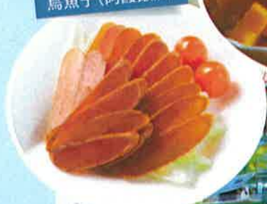
からすみ 烏魚子(阿霞飯店)