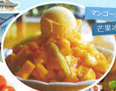
マンゴーかき氷 芒果冰(玉井)