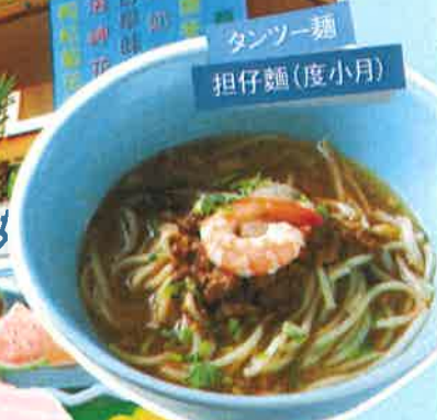
タンツー麺 担仔麵(度小月)