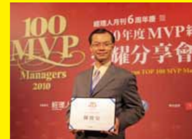
台南市政府觀光旅遊局長