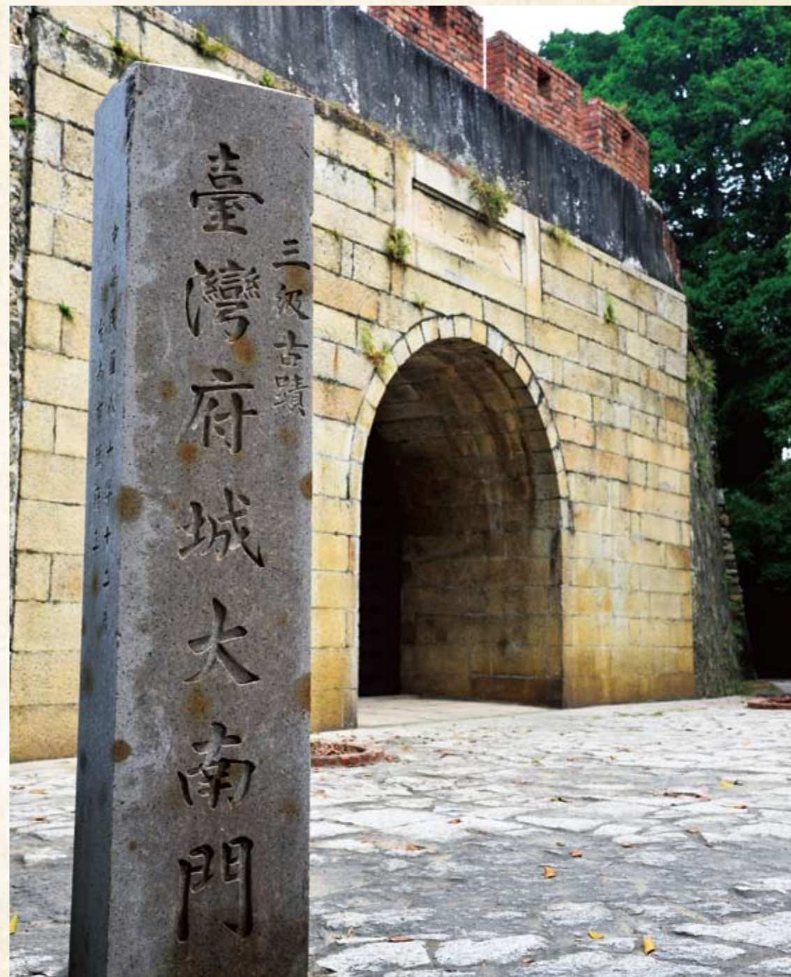
台南大南門—寧南門

今日的省道台19甲線台南段，是歷史最悠久的「古道」。它被清朝設定為「官道」，沿線官府衙門集中，重兵駐守。這條官道是幾百年來台灣各種資源匯流的大動脈，也代表政府統治力量的展現。透過探尋台灣第一條古官道的脈絡軌跡，試圖重建過去的歷史空間，串連台灣歷史三百多年來地理位置的發展與變遷。