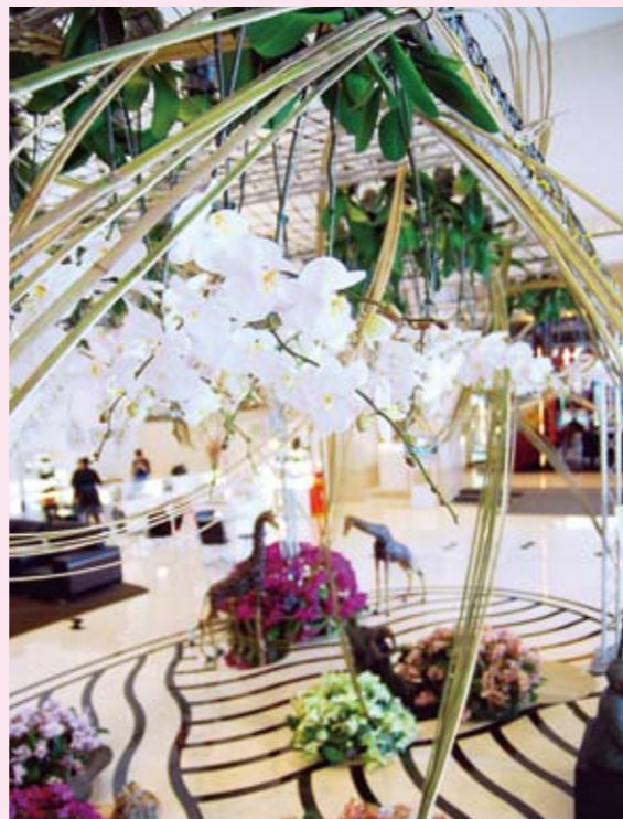
大億麗緻酒店 / 蘭花入口意象佈置

此外，為擴大觀光效益，台南市政府觀光旅遊局亦同步規劃「推動蘭花入口意象佈置競賽」、