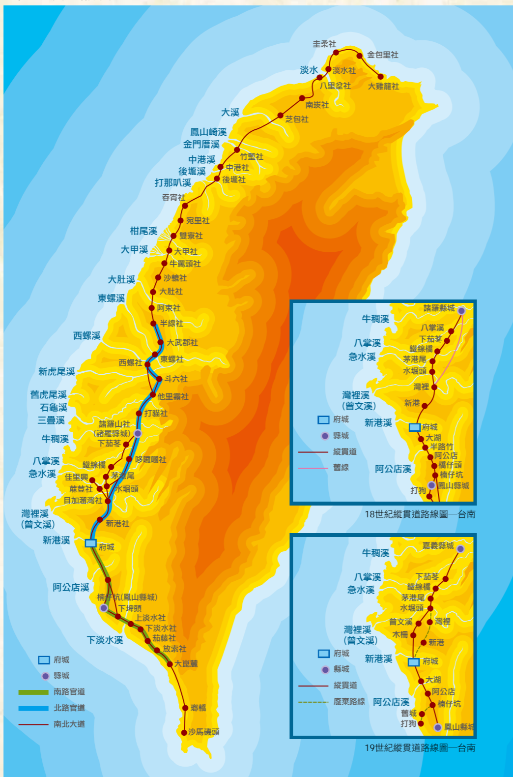
17世紀縱貫道路線圖