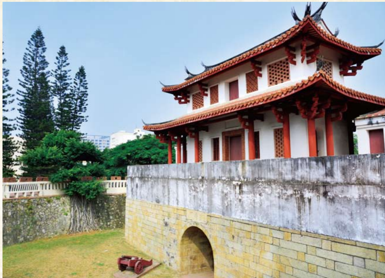
台南大南門—寧南門

此三個水陸交會之地，在十七世紀便已形成商街，也是水陸貨運轉運站，直到十九世紀末都還人聲鼎沸，熱鬧非凡。直到二十世紀初因鐵、公路改線，喪失交通區位優勢而沒落；鐵線橋、茅港尾今