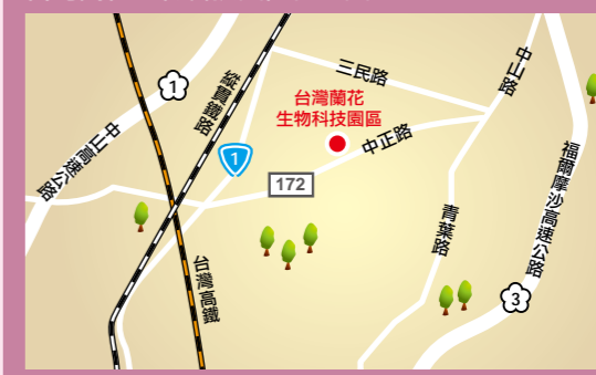
台灣蘭花生物科技園區位置圖

是以，台灣蘭花生技園區的設立，不僅成為南部地區最主要的蘭花生產據點，也是全台最大、最主要的生產聚落。更甚者，能帶動地方相關產業發展，增加當地就業機會；活絡地方經濟與發展，並提升整體國民所得。