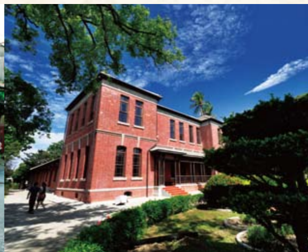
總爺藝文中心紅樓