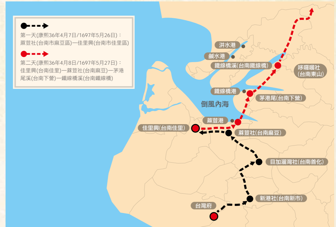
郁永河採硫路線圖

1684年出現的縱貫官道，維持了兩百多年的原始風貌，直到日本統治時代才蛻變成縱貫公路。古官道台南段，就是今日的省道台19甲線；從支離破碎的前身官道、初具現代公路雛形的縱貫道，一直到邁向嶄新的二十一世紀，它真實地串連起三百年來台灣歷史的發展軌跡與地理空間。