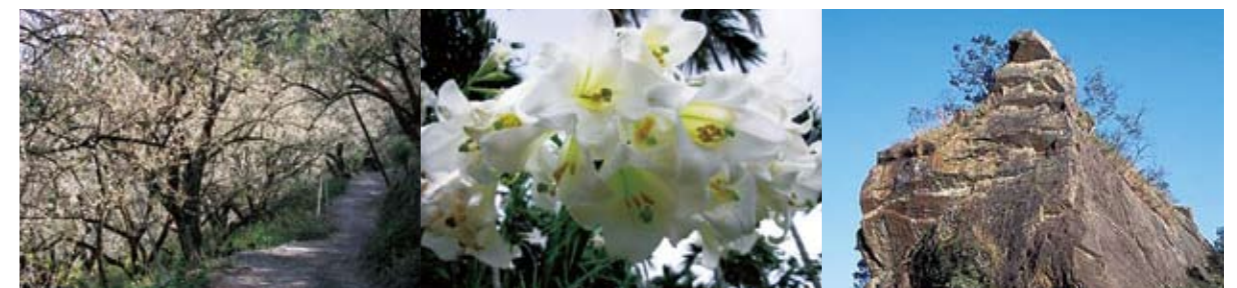
賞梅步道一景