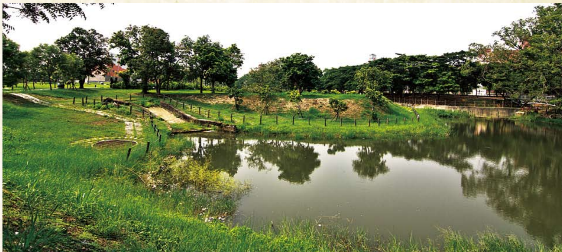
麻豆古港文化園區(水堀頭)

●「慶安宮」：前身是奉祀「五文昌」的「文昌祠」，1862年嘉南大地震震垮「文昌祠」，後經改建擴大規模，改為「慶安宮」。尤其狀似水溝蓋的鐵片，足以印證善化300多年開發史，此為廟方重要的資產—荷蘭古井，也是荷蘭治台的最好見證。當中最引人注目的，乃是清朝康熙皇帝御賜的聖旨牌，上面刻著「皇帝萬歲萬萬歲」。寺廟內有兩幅府城彩繪大師潘春源的壁畫，成為慶安宮重要的文化資產。