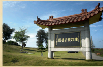
17 鄭成功姑媽(陳桂記台灣鄭媽祖墓) 中洲陳氏第一代祖先陳一桂娶鄭成功姑媽鄭氏為妻，死後安葬於此。