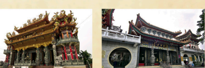
10 六甲赤山龍湖巖 【地址】台南市六甲區瑞隆路198巷1號。 明鄭諮議參軍陳永華所建，諸羅縣志載：「龍湖巖在關化里赤山莊，明官陳永華建」，奉祀觀世音菩薩，為台灣觀音古寺。