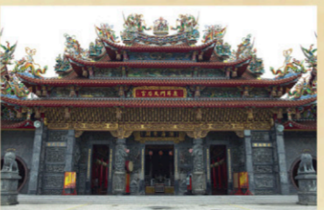
5 鹿耳門天后宮 【地址】台南市安平區媽祖宮1街136號。 明永曆十五年鄭成功登陸鹿耳門後，發現一草茅媽祖廟，就在登岸處搭建媽祖廟供奉軍民膜拜，有「海門之門」之稱。