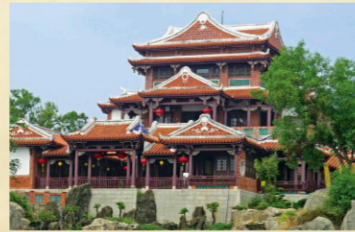
19 南鯤鯓代天府大廳園 【地址】台南市北門區經江里976號。 成功開府東寧，沿海移民日益稠密，當地居民建築廟宇，是五王首次建廟，越廟被稱為南鯤鯓廟。