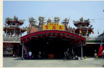
12 茅港尾古港(茅港尾天后宮) 【地址】台南市下營區茅港里8鄰293號。 鄭氏地標記為梅港尾，位在倒風內海港口，鄭成功因軍中之權，於置文溪兩岸四大平埔築聚圍之地及急水溪旁青峰嶼勘視後主張屯壘，迄明鄭、清代，廳署依然興盛，故事館建於古麻豆港水頭碼頭。