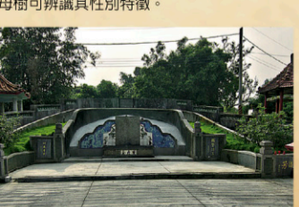
11 明鄭諮議參軍陳永華古墓 【地址】台南市柳營區果毅後。 建於清康熙二十年，永曆三十四年，陳永華奉命而終，與夫人合葬赤山龍湖巖。