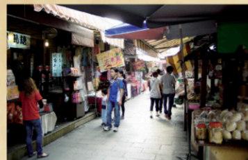
3 安平舊聚落(延平老街) 經過三百年的變遷，這座台灣地區最古老的城堡，今天呈现在世人眼前的有：城隍廟跡、磚砌平台、陳列館、禮堂和古史蹟公園。老街美農林立，穿街老樹，發現驚奇。