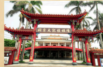
16 學甲中洲陳桂記大宗祠 【地址】台南市學甲區中洲里中洲15-10號。 明鄭1661年入台，陳輝輝一姓聚族在頭港，與將軍澳祥「頭前寮」登陸，在兩地間淨洲建立聚落，取名「中洲」。