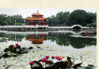
5 永康六甲頂姑婆廟 【地址】台南市永康區尚頂里正南一街146號。 陳永華諮議參軍陳永華仔這個隨行高點隨行官邸，官邸中有一位出嫁的女管家，據傳是陳諮議參軍的姪女。女管家一遇未離官邸，死守至逝世，但神靈不曾離官，屢屢有神蹟，附近居民於是建小廟奉祀稱為姑婆廟，直到民國22年方重建姑婆廟。