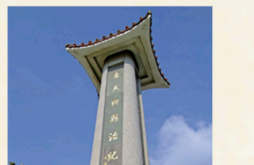
10 佳里興古天興縣治紀念碑 【地址】台南市佳里區佳里興325號。 興興前立「古天興縣治紀念碑」一座，明鄭時期設天興縣治於此。