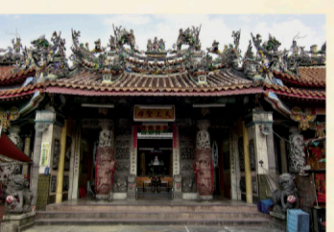
8 新市大營公園 【地址】座標：17900 2555786。 當年鄭成功，宣布屯田政策，可稱英年早逝。陳永華繼而率軍屯駐台南平原，今之大營村即是當時在武衛營區，大營分營區，營尾，營頭環境清幽，據說陳永華在此飲酒，並於土地公廟前植下兩棵榕樹，如今已枝葉繁茂公樹與母樹可辨其性別特徵。