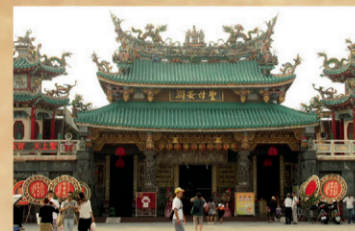
1 安平開台天后宮 【地址】台南市安平區國勝路33號。 於明永曆二十二年(1668)，由鄭軍官兵與民衆拆毀熱蘭遮城內荷蘭教堂，就地興建媽祖宮，此即安平開台天后宮的前身。