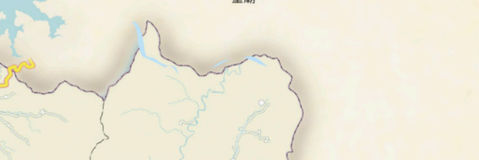
4 台南公園 【地址】台南市北區公園路356號。 明鄭時期為陳永華府邸，陳永華成立「天地會」，在「紅花園」戲水為盟即今台南公園燕潭與蓮花池間一片草地。