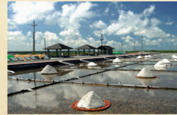
18 北門仔腳瓦盤鹽田 【地址】台南市北門區永華里并仔腳。 原稱鹽灘場，鄭氏諮議參軍陳永華引進「淋鹼曬鹽法」，本地水車運水為紀念陳永華軍功命名。