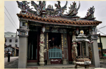
13 鐵線橋古通濟宮 【地址】台南市新營區鐵線橋鐵線橋40號。 鐵線之名，荷蘭人稱之為Terraemissio，漢人入墾因港而築橋，適濟官廳堤前，即為首白船隻停泊處。