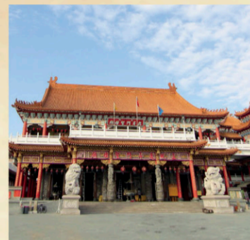
6 土城正統鹿耳門聖母廟 【地址】台南市安平區城安路160號。 12世紀末葉已隨著漁民的東來而興位於臺灣西南沿海，占臺江西緣北線(山)尾嶼北邊的鹿耳門嶼。明永曆十五年(1661)，延平郡王鄭成功來台驅荷，登岸踏勘當地尊見媽祖廟，乃入內焚香祈禱，祈求鹿耳門媽祖庇祐，明永曆十六年(1662)春，荷人投降降臺後，為答「鹿耳門媽」顯靈相助之恩，乃大興土木重建神廟於登陸處。