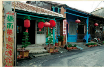
14 鹽水月津港、橋南老街 【地址】台南市鹽水區橋南街。 明鄭時期稱為鹽港，是倒風內海港口，位開海陸交通樞紐，形成熱鬧街市。