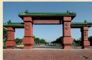
7 鄭成功紀念公園 【地址】台南市安平區城西街二段。 相傳1661年鄭成功登陸之處即在此地，為紀念鄭成功之事蹟，聖母廟捐地建立了此紀念公園。