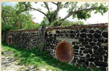
4 四草砲台(北汕尾古戰場) 【地址】台南市安平區大家街360號。 明永曆十五年，鄭成功率軍自鹿耳門進入台江內海，荷軍在隊長鬼拔仔(Thomas Peadar)帶領下，登陸北線尾，和鄭軍展開第一次陸上會戰。