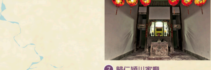
7 歸仁額川家廟 【地址】台南市歸仁區大廟里大廟1街28巷46號。 明鄭時期，大量漢人來台開墾，陳世倌4兒弟，隨鄭軍渡海來台，於今歸仁落地生根。