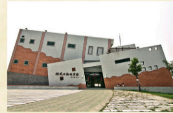
11 麻豆古港文化園區、倒風內海故事館 【地址】台南市麻豆區水頭。 麻豆港為倒風內海港口，是當時對外貿易重要港口，荷蘭人稱之為「麻豆港」，漢人入墾因港而築橋，適濟官廳堤前，即為首白船隻停泊處。