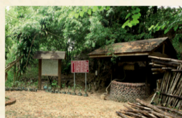
9 佳里北頭洋蕭壩社故址及荷蘭井 【地址】台南市佳里區海邊里番仔寮66-1號。 蕭壩社是西拉雅的一社，1636年為維持獨立而與荷蘭人發生戰爭，北頭洋是蕭壩社故地，荷蘭人稱蕭壩為城，荷蘭井位於「飛沙崙」山麓，當時荷蘭人開鑿4口井作為民生與灌溉用水。