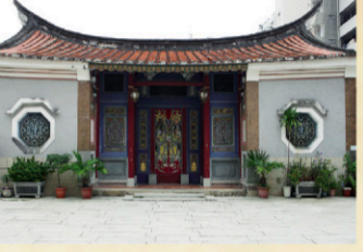
3 陳德聚堂 【地址】台南市中國路二段152巷20號。 建於明永曆18年，是台南最早的祠堂，據傳是當時陳澤府部或為「諮議參軍陳永華府總制使」陳永華的府邸，稱為「總制府」。