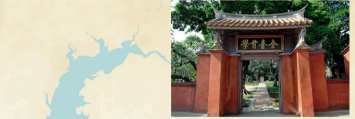
2 台南孔廟 【地址】台南市中區南門路2號。 明鄭時期經採諮議參軍陳永華建議，於永曆二十年完工，地點在承天府舊址，以先師聖廟為主體，旁設明倫堂，為台灣創建最早孔聖廟。