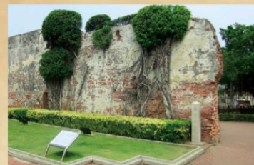
2 安平古堡(熱蘭遮城殘蹟) 【地址】台南市安平區國勝路82號。 荷人治台38年，最為人熟知的是熱蘭遮城，數百年後僅存外城牆遺蹟及內城北側半圓形殘蹟，現以「熱蘭遮城遺址城內建築遺構」指定為國定古蹟。