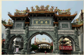
15 學甲上白礁請水之地-白礁亭 【地址】台南市學甲區濟生路170號。 學甲慈濟宮主神保生大帝，係明末由福建泉州府移民迎請，隨鄭成功部隊來台，由學甲頭前寮將軍澳祥會。