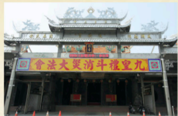
8 西港慶安宮 【地址】台南市西港區慶安路32號。 鄭成功登台派兵順水路入西港駐紮，隨身恭請媽主公、中壇元帥以作庇護。