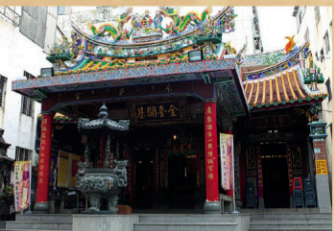
1 全台灣開基永華宮 【地址】台南市中西區府前路一段196巷20號。 創於明永曆十六年，「鎮殿老大王」為陳永華自編建南安鳳山寺恭迎，為台灣最早且唯一的「教尊黃澤尊王」金身。

陳永華 (1634年-1680年)，字復甫，號文正，福建漳州府龍溪縣人，乃明末舉人陳鼎之子。陳永華十五歲時，其父任同安縣教諭(相當現教育局長)。清兵入閩時，陳鼎殉國，鄭成功在廈門開府時，陳永華才二十三歲，1656年(永曆十年)得兵部侍郎王忠孝推薦，與鄭成功對鄭經發表見解、分析未來，深得鄭成功的賞識，並舉「永華乃今之臥龍也」，授予「諮議參軍」之職，並為其子鄭經之師，日後便成為鄭家麾下的謀將。民間則相傳他化名陳近南，開創了反清團體天地會。