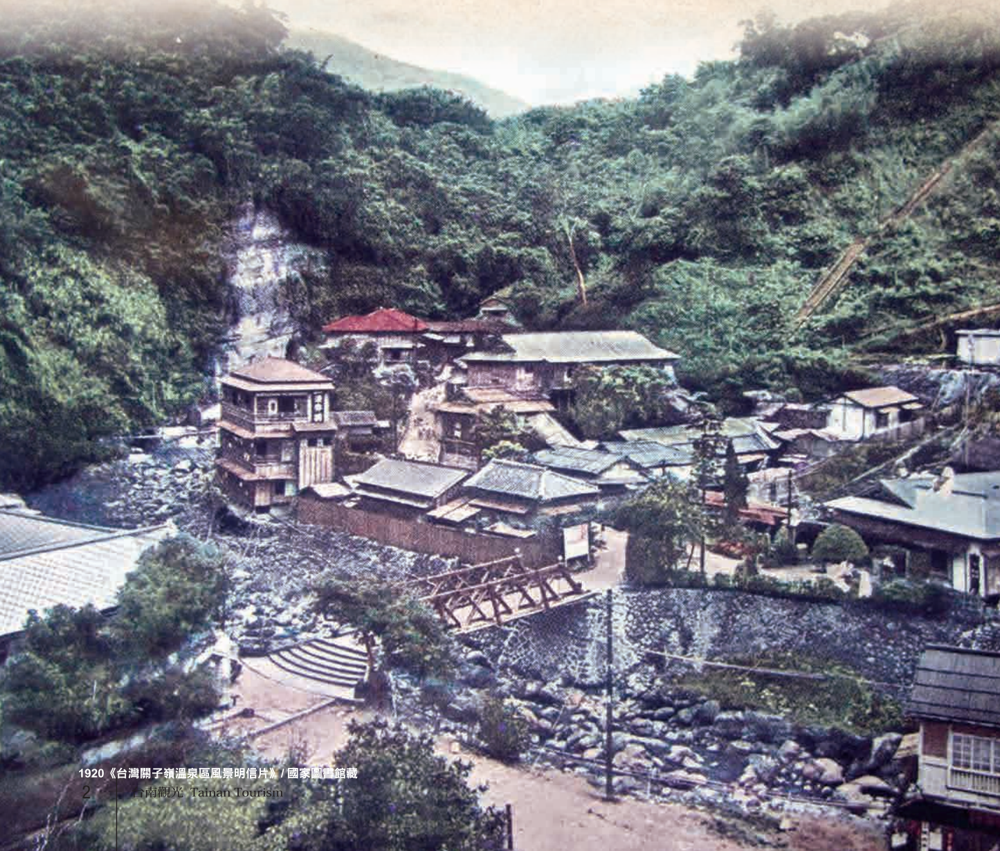
1920《台灣關子嶺溫泉區風景明信片》/ 國家圖書館藏

水與火，是人類生存與進步不可或缺的元素，是推動歷史文明前進的能量，而這兩種看似相互抗衡的自然元素，在台南關子嶺地區卻共生共容出水火同源、泥漿溫泉的珍貴自然奇景，啟動了關子嶺地區300年豐富的人文歷史故事。