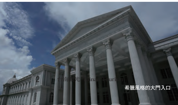
希臘風格的大門入口