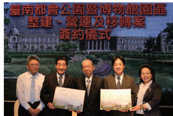
台南都會公園博物館 ROT 案 簽約儀式

都會公園以博物館為核心佔地約 10 公頃，歷經五年興建完成，主建築樓高 3 層，挑高規劃為 2 層使用。博物館的建