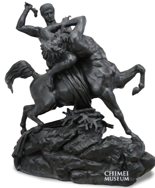
雕像《鐵修斯戰勝人馬獸》

奇美館於 1998 年在歐洲拍賣會購得，一直是館藏的重量級作品。由於它在西方藝術史上有重要的代表性，在 2012 年日本 NHK 策劃舉辦西方藝術矯飾主義大師「艾爾·葛雷柯回顧展」時，就曾受邀出借作為該次展場「祭壇畫」的代表作品。