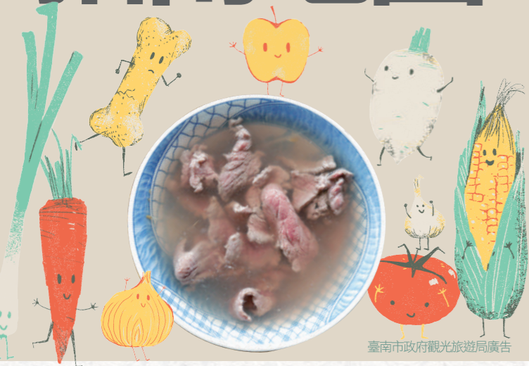
臺南市政府觀光旅遊局廣告