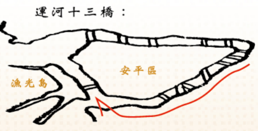
運河十三橋： 安平區 漁光島 (背面圖示依順時針方向)

上岸好遊趣 安平舊聚落，是台灣最早的漢人聚落之一，至今街廓與古韻猶存，在歡悅熱絡的觀光氣息之中，也適合靜心緩步走一趟穿越之旅。