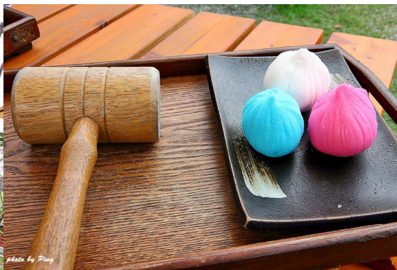
▼開運彩塩焼(雪鹽燒) 40元/顆