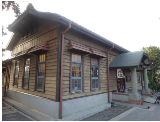
*原為「臺灣總督府專賣局臺南支局安平分室」充滿日式風格的建築