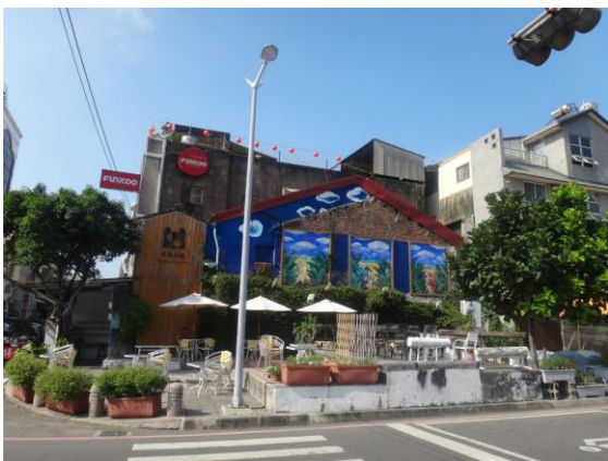
*怪獸茶舖白天一景

吃完好吃的豬心冬粉，接下來驅車沿著海安路向北就會到達台南最大的夜市-花園夜市，裡面應有盡有，不管是吃的玩的穿的用的通通都找的到，就算是吃飽了來這裡逛還是會忍不住的嘴饞買些東西吃，逛累了可以回去海安路上的怪獸茶舖點個飲料歇歇腳，怪獸茶舖是由老屋改造後的一間店，整間店在改裝後給予了房子新的生命，在特調飲料的方面也很不賴。