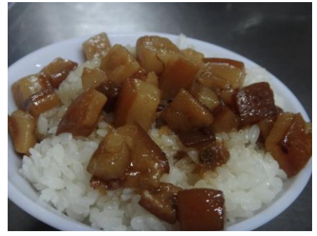
*讓人一口接一口的肉燥飯

吃完讓人精神一振的鹹粥之後來買個伴手禮吧，隱藏在小巷子裡的這間祿記外表看起來雖然不起眼但可是一間從清光緒年間就已經創立的老店，裡面賣的有包子和水晶餃，水晶餃的數量很多現場買就有了，但是包子就是限定的要預定的客人才會拿到，沒預訂的人就要靠運氣嘍。有著半透明又Q軟外皮的水晶餃裡包了滿滿的竹筍丁和肉塊，一口咬下去十分的滿足。只是台南的口味大部分偏甜這加水晶餃也是，是好是壞就看各人的觀感嘍。