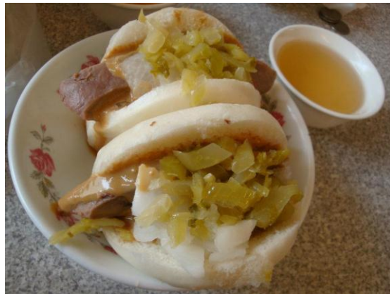
*一份有兩個，豬舌包是最快賣光的，滷過的豬舌彈脆有嚼勁再加上酸菜跟特製花生醬的搭配清爽又不油膩