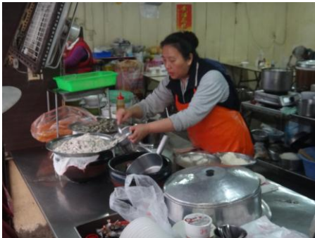
*桌上擺了挑好刺的魚肉和滿滿的蚵仔

這家位於大勇街的鹹粥是在地人才會知道的美味，清晨五點就開始賣直到賣完為止，通常到了中午前就已經賣完了，台南的鹹粥其實更像是泡飯，粒粒分明的。一碗鹹粥裡有滿滿的魚肉和蚵仔，湯頭更是飽含了海鮮的鮮味再加上一點油蔥跟芹菜的點綴，在冬天寒冷的早晨吃了一口讓人全身暖呼呼的精神都來了!這裡的肉燥飯也值得一提，雖然上面都是肥肉，但吃起來完全沒有油膩感，一進口裡馬上隨著口內的溫度融化掉，配上剛剛好的醬汁，讓人一口接一口瞬間就把整碗給吃掉。