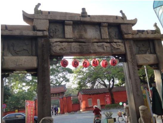
*坐落於孔廟對面的府中商圈