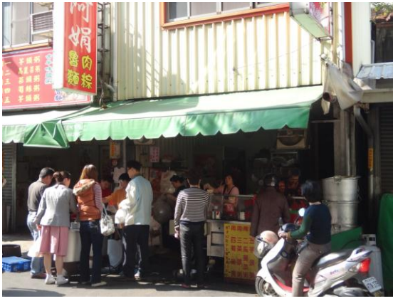
*一到中午總是人滿為患

吃飽撐著鼓脹的肚子當然就是要走路來消化一下了。既然來到台南不免俗的就是逛一下古蹟，位於南門路上的孔廟可以在附近找停下車來，用徒步的方式去欣賞台南的古蹟以及台南特有的氛圍步調，對面有許多文創商店藏在小巷弄裡府中商圈更是不容錯過，逛完後沿著南門路一直往北走會遇到民生綠園，在那上面的台灣文學館不僅是一座擁有百年歷史的國定古蹟，更是台灣第一座國家級的文學博物館。