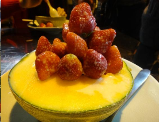
*人山人海的泰成水果店