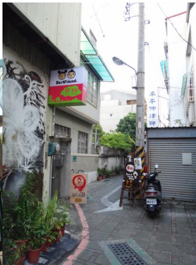
*有許多隱藏在小巷弄裡的文創商店