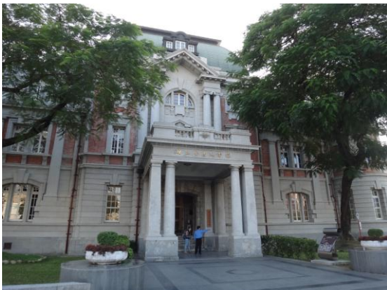
*擁有百年歷史的台灣文學館