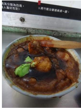
*扎實的碗粿裡面還有蝦仁、香菇肉燥、瘦肉等等的料加上芥末更好吃!