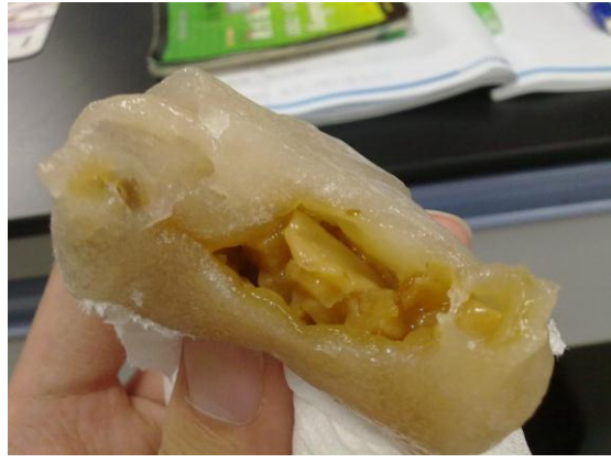
*滿滿竹筍丁和肉塊

午餐就去台南最負盛名的小吃街-國華街覓食去，熱鬧的國華街一整條都賣食物，其中最著名的就是靠近民族路的交叉口那附近的店家，富盛號碗粿、金德春捲和阿松割包，這三家的位置非常接近，所以在午餐時間的時候總是大排長龍造成馬路水洩不通，所以要去的朋友建議先去停車再走過去會比較好。小技巧是大家分頭去買這三家再去其中一家分著吃，既可以全部都吃到又不用怕站到腳痠。