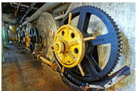
臺南市仁德區 仁德糖廠 夢糖工廠~ 這大大的齒輪所轉動的正是屬於我們 那甜甜的蜜糖回憶~