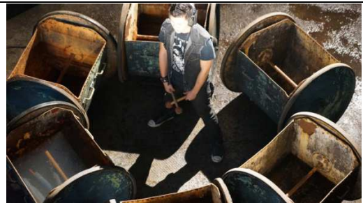
臺南市仁德區 仁德糖廠 夢糖工廠~ 輪庫車 擊奏樂曲 by 手合鐵鼓樂團