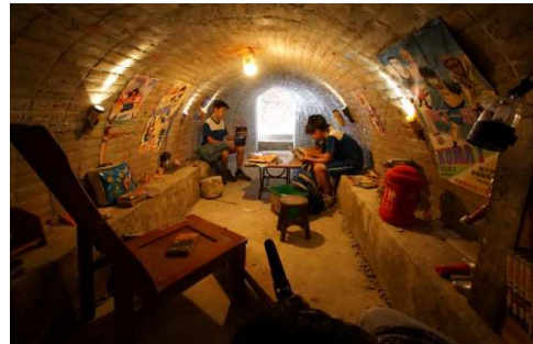
臺南市仁德區 仁德糖廠 夢糖工廠~