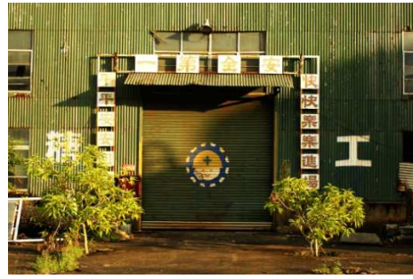
臺南市仁德區 仁德糖廠 夢糖工廠 ~ 這深鎖十年的工廠大門，誰來開啓它 開啓~這段屬於您我的共同回憶~