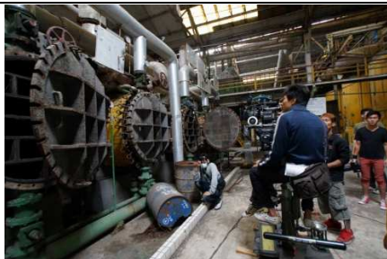
臺南市仁德區 仁德糖廠 夢糖工廠~ 蔗汁加熱器~因爲它的不可捉摸 所以 我感覺出這裡是有生命的~