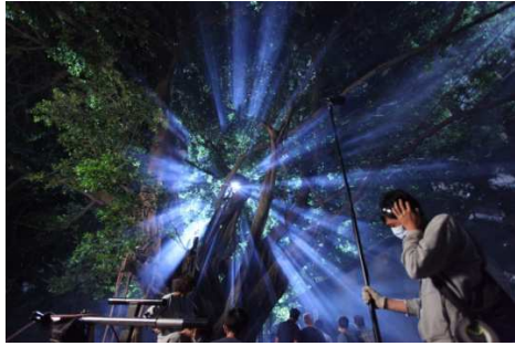
臺南市仁德區 仁德糖廠 五行聖樹~ 爲了這短短的幾分鐘片段，劇組員花費許多夜晚拍攝，就爲了呈現出最完美的畫面~