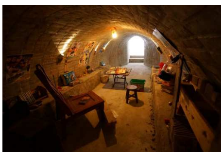
臺南市仁德區 仁德糖廠 夢糖工廠~